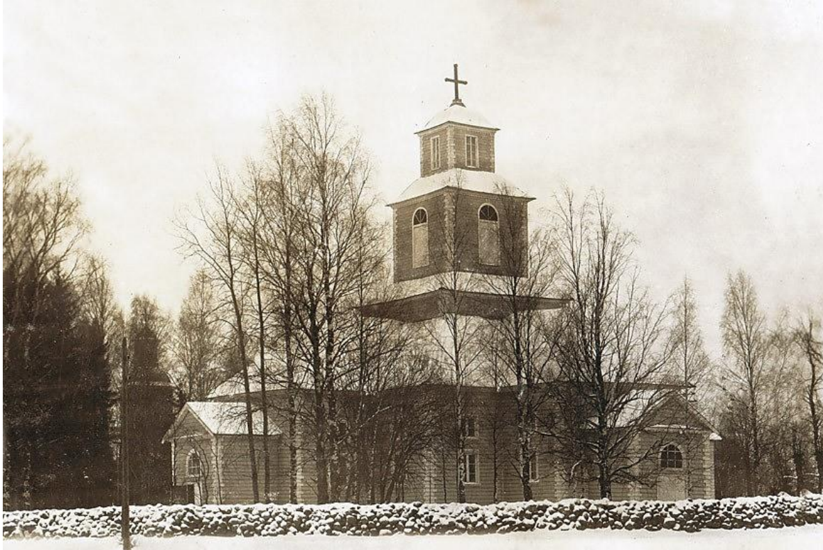
Raudun viimeistä edellinen kirkko Varikselan kylässä 1823-1918. Kellotapuli näkyy oksiston takana kirkon vasemmalla puolella hieman taaempana.

ehditty hankkia kellot, lahjoitettiin tämä kello Suomen Lähetysseuralle, joka lahjoitti sen edelleen Ambomaaalle. Ambomaa on nykyisen Namibian maakunta pohjoisen naapurivaltion Angolan rajalla.