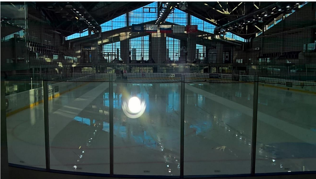
Jäähallin jäätä kunnostetaan. Kirkas läiskä jäässä on valoheijastuma. Tässä hallissa presidentit Niinistö ja Putin pelasivat jääkiekkoa. Ei ole julkaistu tietoa siitä, kumpi voitti.