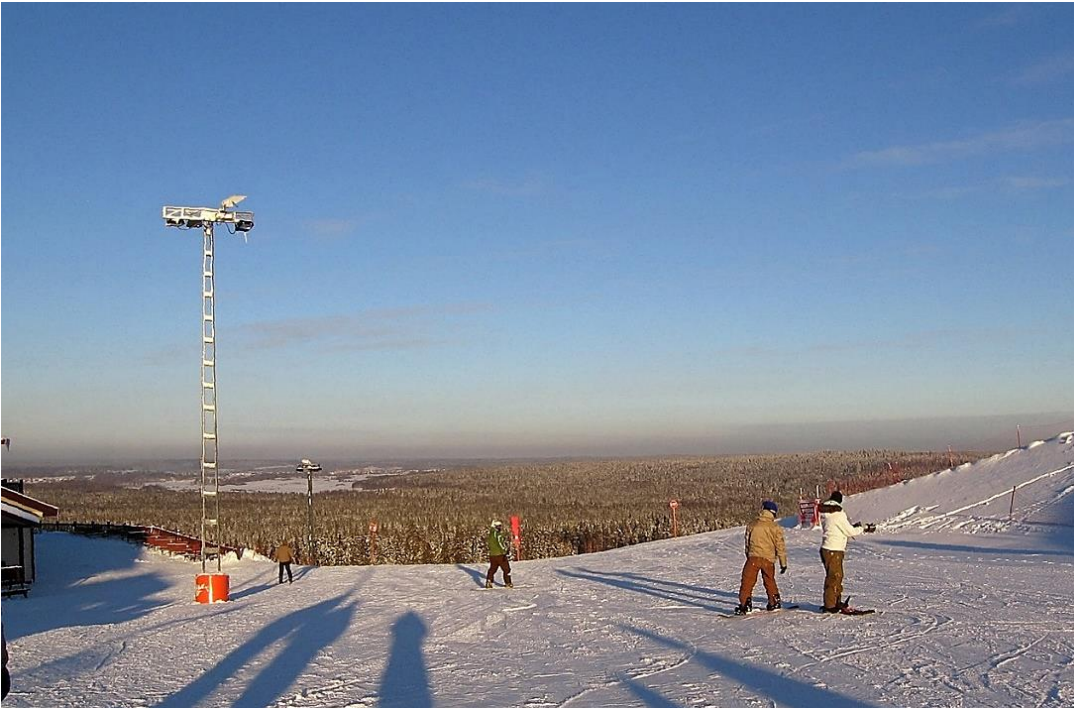
Talvinen maisema laskettelurinteeltä. Alhaalla metsän peitossa on Pietarista johtava rautatie. Junan ääni kuuluu selvästi varsinkin kesäiltoina.