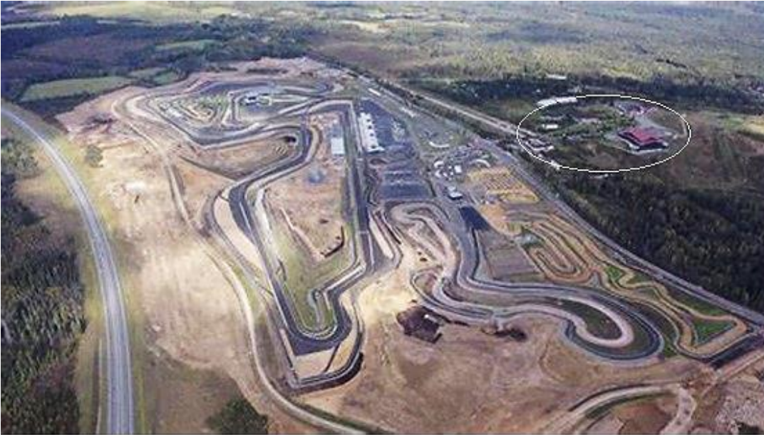
Ilmakuva Igoran alueesta. Kuvaa hallitsee moottorirata. Sen oikealla puolella valkealla renkaalla ympäröitynä vanhan maantien vieressä olevat Igoran liikuntakeskuksen rakennukset. Moottoriradan vasemmalla puolella moottoritie Pietariin. Kuvan suunta on Raudun keskusta päin.