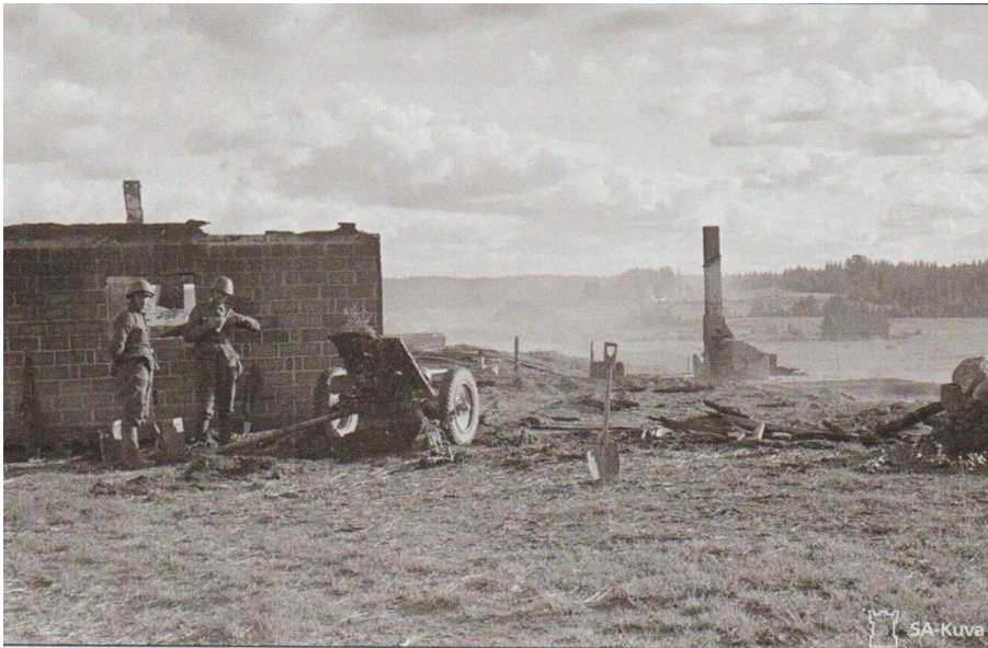
Raudun Huhdin kylän Leppäsenmäki on vallattu. Ilmassa on vielä sodan savuja. Suomalaisten pstykki on antanut viholliselle lisävauhtia.