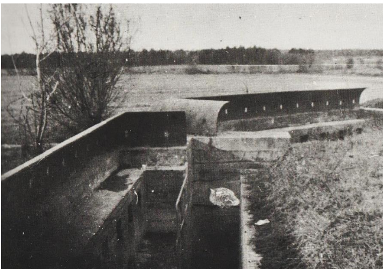
Alcazarin linnake. Katolla teräslevyt ampuma-aukkoineen. Edessä on Taipaleenjoki.

Vihollinen eteni nyt Koukunniemen miehittämättömään etuosaan 6.12.1939 ja aloitti puoli-iltaisin hyökkäyksen Koukunniemen suomalaisasemia vastaan. Venäläiset hyökkäsivät panssareiden tukemana myös Acazarin tukikohtaan ja valloittivat sen. III Armeijakunta piti tukikohtaa niin tärkeänä, että käski valloittaa sen takaisin. Tehtävä annettiin ensin Metsäpirtin osastolle. Se aloitettiin seuraavana aamuna vielä pimeään aikaan ja johti joukon hajautumiseen erillään taisteleviksi ryhmiksi. Iltapäivällä aloitettu uusi hyökkäyskään ei menestynyt sen paremmin. Vielä yritettiin JR 28:sta irrotettujen vahvennusten avulla, mutta tämänkin venäläiset torjuivat panssarivaunuin ja tykistötulella. Suuri vihollisosasto oli jo ehtinyt kaivautua puolustusasemiin. Vastahyökkäykset uusittiin vielä kahdesti, mutta samoin tuloksin. Tappiot olivat huomattavat ja suomalaisten oli vetäydyttävä takaisin pääpuolustusasemaansa 7.12.1939. Vielä kerran Metsäpirtin osasto yritti vastahyökkäystä 12.12., mutta turhaan. Lopulta Alcazarista päätettiin luopua sen epäedullisen sijainnin vuoksi, ja tukikota jäi pysyvästi venäläisten haltuun.