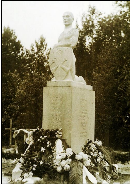
Raudun sankaripatsas. Paljastettu 16.5.1921.

Eräänlaisena yhteenvetona voitaneen todeta, että sankarimuistomerkin kivessä ovat niiden rautulaisten valkoisten nimet, jotka kaatuivat taisteluissa edellä selostetuin epätarkkuuksin. On hyvin ymmärrettävää, että heti sodan jälkeen tietojen keruu ja määritelmä sankarivainajista oli ongelmallista.