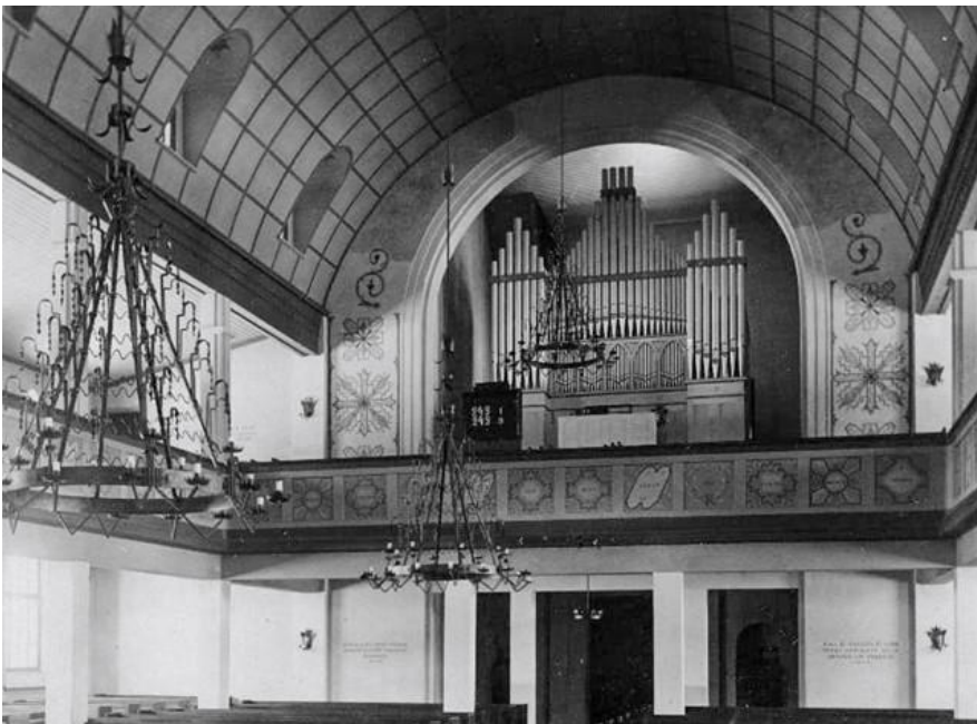
Sisäkuva länsipäädyn urkuparvesta.

Altari ja sen takana oleva sakasti olivat vanhan kirkkoperinteen mukaisesti itäpäädyssä. Varsinaista alttaritaulua ei ollut, vaan sen paikalla oli musta puinen risti taustanaan seinälle maalattu seppelkehä. Yksinkertaista, mutta vaikuttavaa kristillistä kuvakieltä. Kirkkorakennuksessa oli lisäksi seurakuntasali ja kellaritilat.