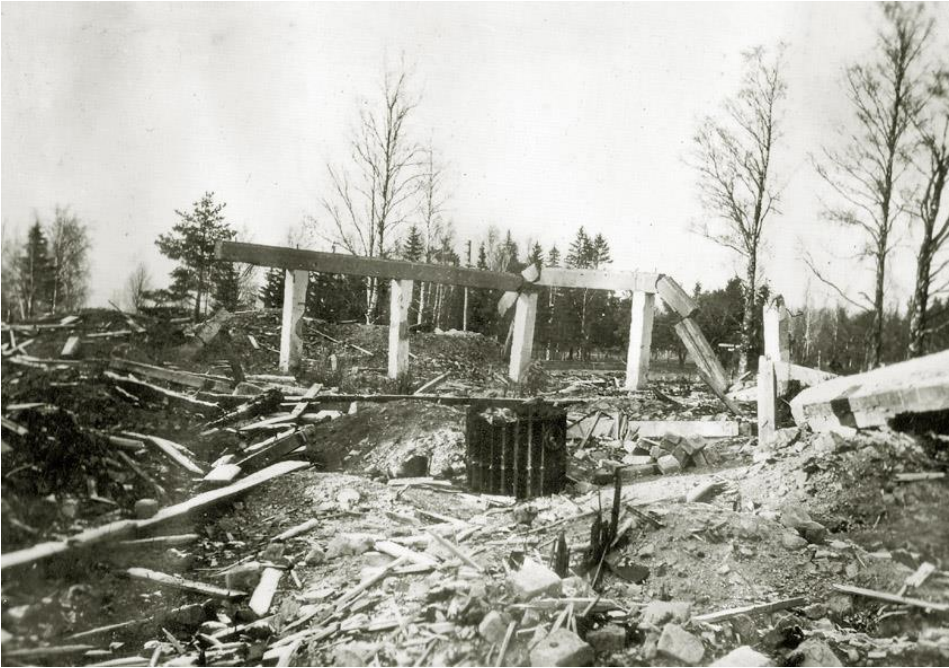
Raudun kirkon rauniot talvisodan jälkeen.

Raudun seurakunnan kirkkoherranvirasto siirrettiin Pieksämäelle, ja seurakunta lakkautettiin vuoden 1949 lopussa. Päätätjäisjuhla oli tapaninpäivänä 1949 Mikkelissä.