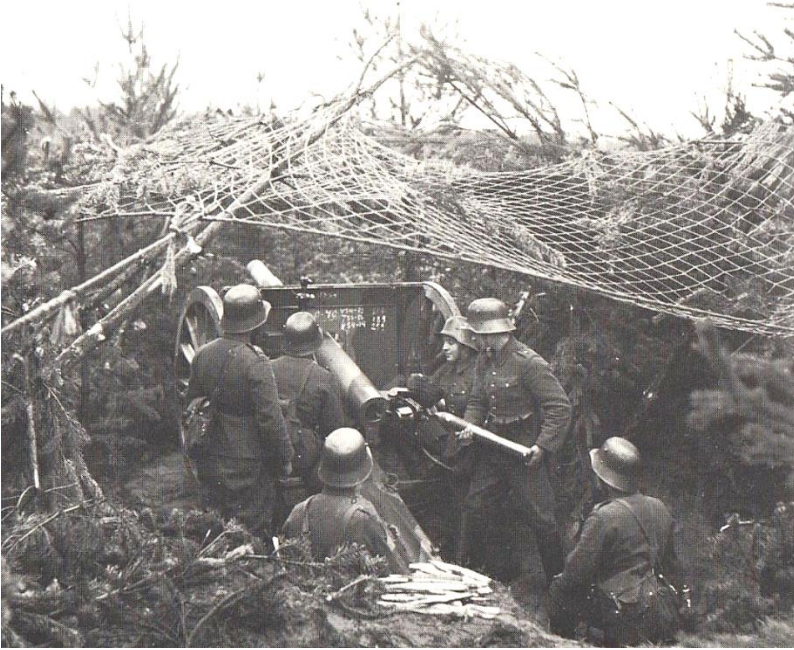
Tykkiharjoitus Raudun Vehmaisissa YH:n aikana. Tykkinä kolmituumainen 76K/02 vuosisadan alusta. Huomaa ammuksen vaatimaton koko lataajan käsissä.