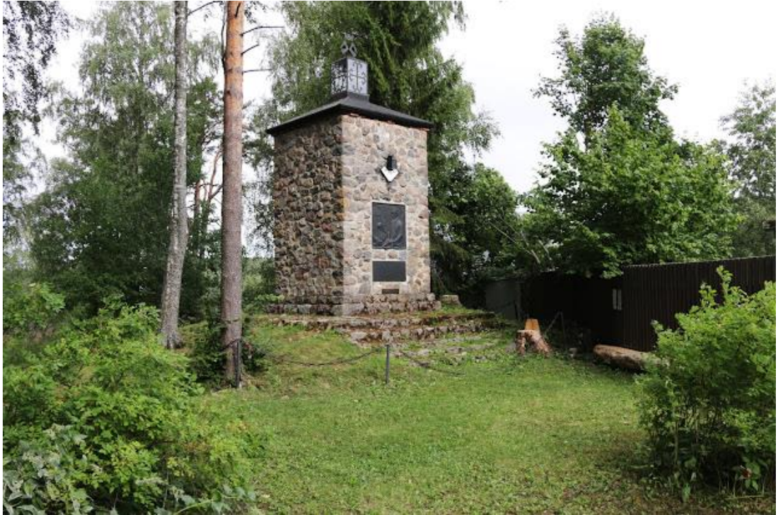
Rautulaisten ja sakkolalaisten lahjoitusmaatalopojien yhteinen muistomerkki Sakkolassa Petäjärven emäntäkoulu alueella. Patsaan suunnitteli Aarno Karimo .