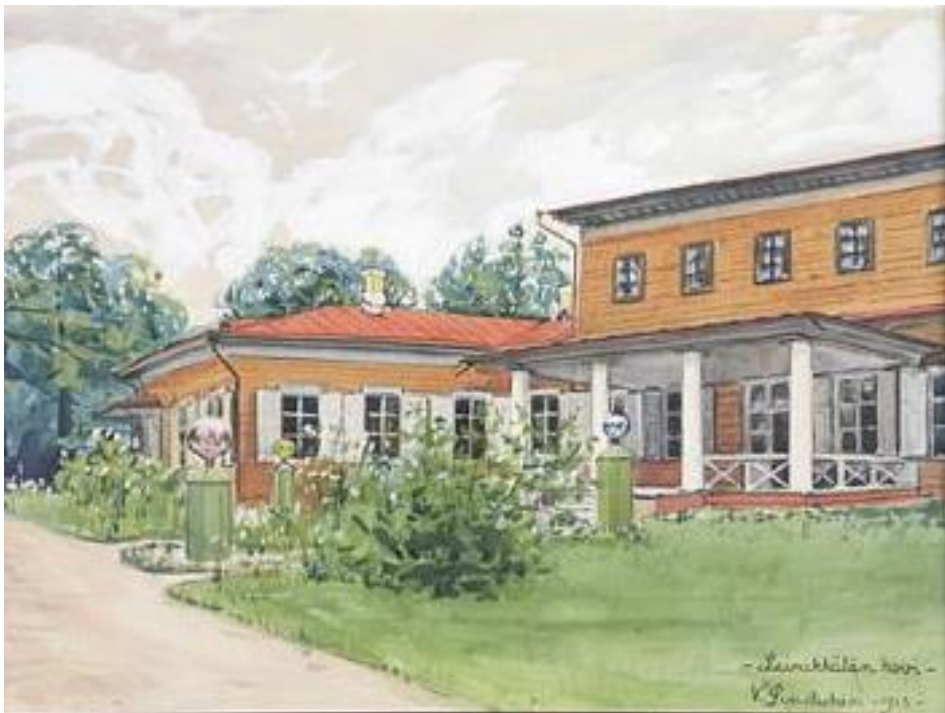
Leinikylän hovi. Maalaus vuodelta 1913.

Vehmaisten hovi , johon kuuluivat seuraavat kylät: Haapakylä Huttula, Keri-pata, Kuusenkanta, Leinikylä, Luukkolanmäki, Maanselkä, Mitronmäki, Mäkrä, Orjansaaari, Pirholanmäki, Sissonmäki, Suurhousu, Terolanmäki, Tokkari ja Vepsa. Tiloja oli yhteensä 58.