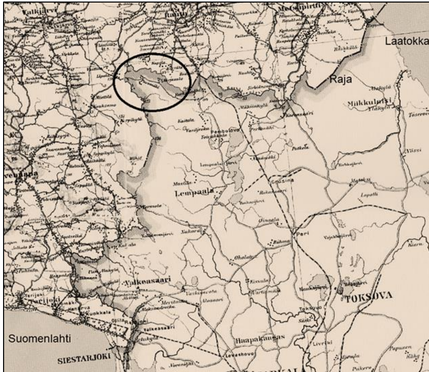
Pohjois-Inkeri Karjalan kannaksella. "Kirjasalon tasavalta" on ympyröity alue Raudun ja Kivennavan välillä ns. Kirjasalon mutkassa.

Tarton rauhassa 1920 Suomi luovutti Kirjasalon Neuvostoliitolle, joka taas ilmoitti takaavansa Inkerinmaan kulttuuriautonomian. Lupaus ei kuitenkaan toteutunut.