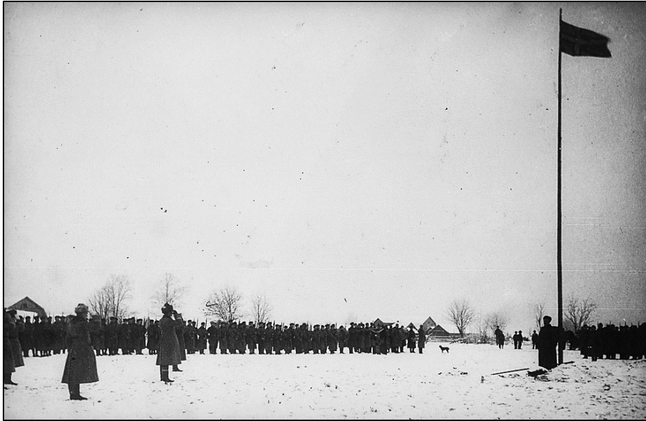
Tasavallan loppu. Lipun lasku 5.12.1920.