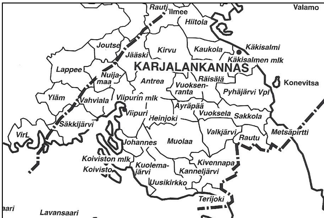
Karjalan Kannaksen kuntakartta

Karjalan kannaksella oli 34 luterilaista ja 19 ortodoksisia kirkkoa sekä yksi (roomalais)katolinen kirkko. Kannaksella käsitetään tässä artikkelissa vain maa-aluetta Hiitolasta etelään. Laatokan luostarisaaret Valamo ja Konevitsa sekä Suomenlahden saaret Suursaari, Lavansaari, Tytärsaari ja Seiskari on jätetty tämän alueen ulkopuolelle. Varsinaisten kirkkojen lisäksi oli muutamia luterilaisia rukoushuoneita ja ortodoksisia tsasounia, joita niitäkään ei tässä artikkelissa lähemmin käsitellä.