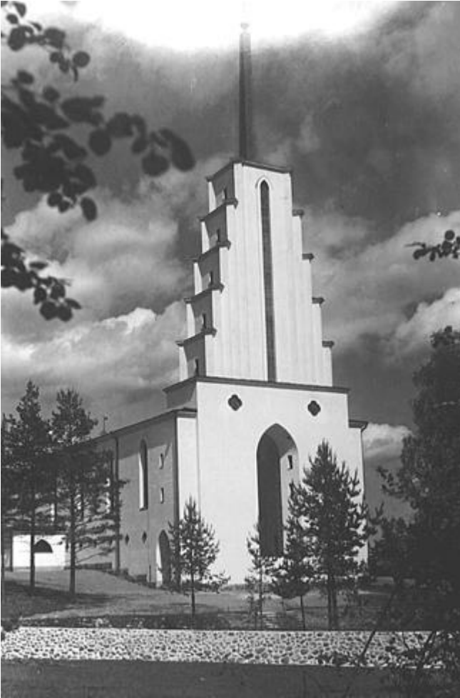
Äyräpään kirkko ennen Talvisotaa. Oiva Kallio 1934.