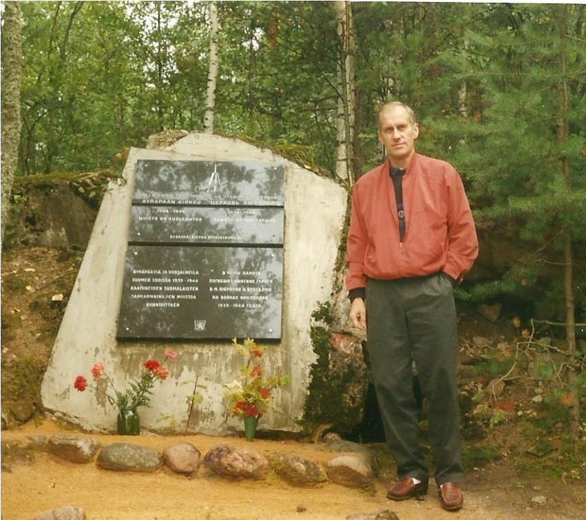
Kirjoittaja Äyräpään kirkon paikalle pystytetyn muistolaatan edessä v. 1998. Taustalla muistomerkin vasemmalla puolella näkyvä betonilohkare on jäänne kirkon rauniosta.