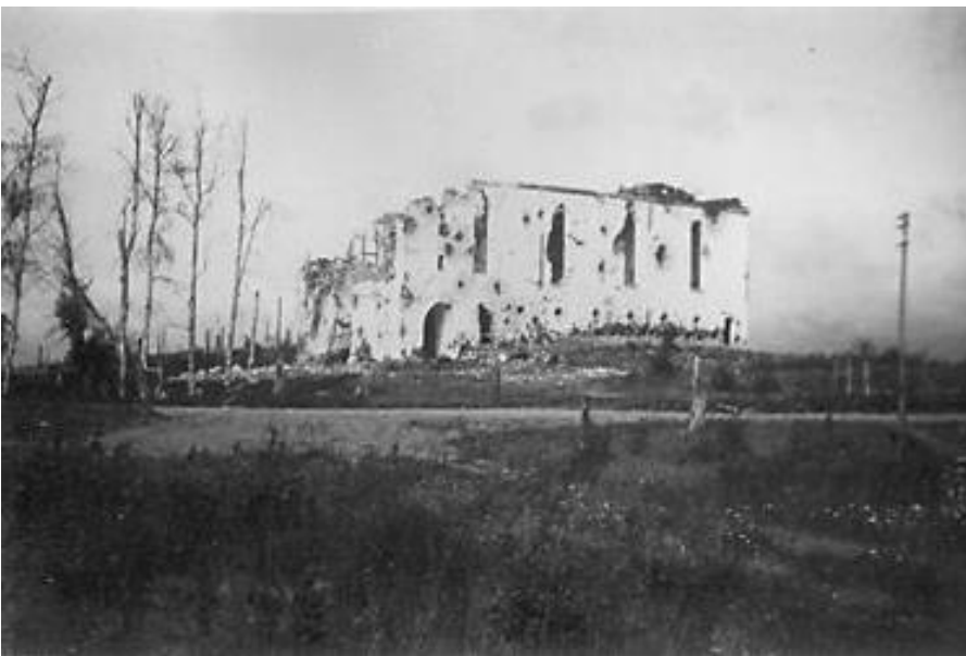
Äyräpään kirkon rauniot Talvisodan jälkeen.