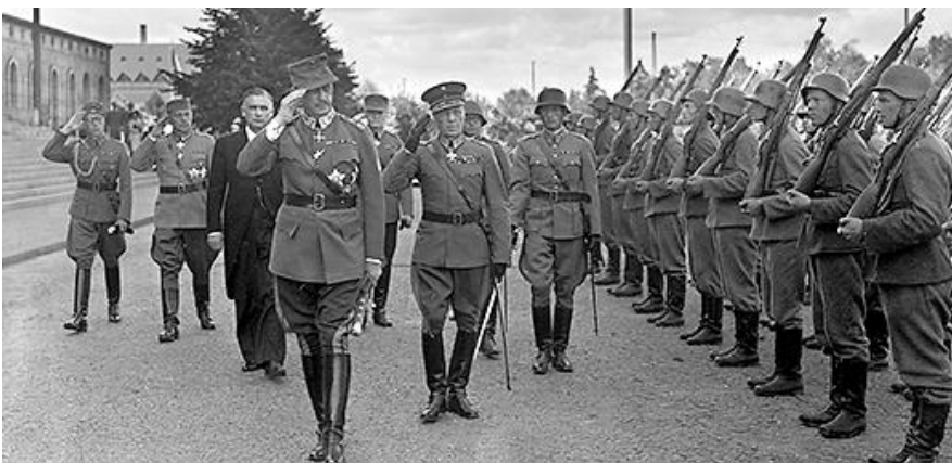
Tasavallan presidentti Mannerheim tarkastaa kunniakomppanian eduskuntatalon edessä 4.8.1944.

Suurlähettiläs Kollontai ilmoitti 12.7.1944, ettei Venäjä vaatisi enää ehdotonta antautumista. Se rauhoitti hieman. Presidentiksi 4.8.1944 valittu Mannerheim ilmoitti 24.8.1944 Kollotain välityksellä Suomen olevan valmis pyrkimään rauhaan. Venäjä vastasi olevansa valmis ottamaan suomalaisen valtuuskunnan vastaan ehdolla, että Suomi olisi julkisesti katkaissut Suhteensa Saksaan ja vaatinut sitä poistamaan joukkonsa Suomesta 15.9.1944 mennessä. Aikaa vastaukselle annettiin yksi vuorokausi. Eduskunta hyväksyi suljetussa istunnossaan ehdot 2.9.1944. Pääministeri Hackzell ilmoitti suhteet Saksaan katkaistun ja vuorokautta myöhemmin päämaja antoi käskyn taisteluiden lopettamisesta 4.9.1944 klo 7.00. Aikaa ei ollut poliittiseen vitkasteluun, valiokuntakäsittelyihin eikä hallintobyrokraatiaan nykytapaan.