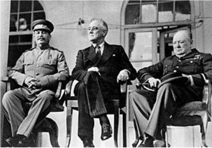
Teheranin kokouksen pääneuvottelijat vas. Stalin, Roosevelt ja Churchill.