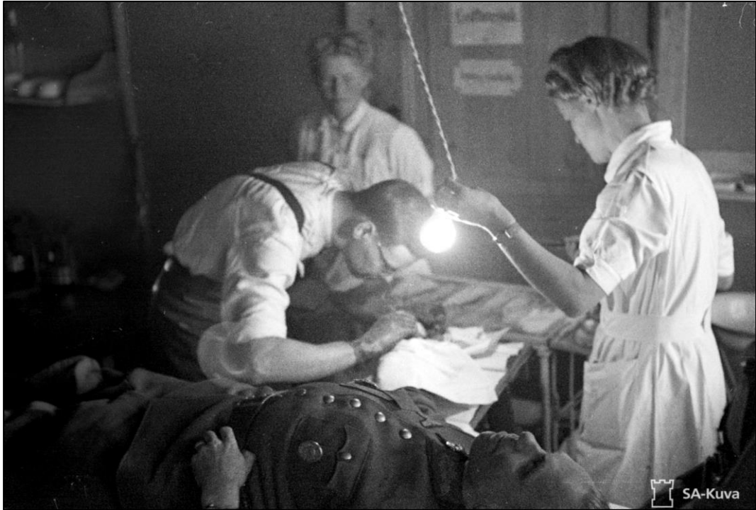
Käsioperaatio meneillään 15. Kenttäsairaalassa. Varmuutta ei ole siitä, millä paikakunnalla sairaala oli kuvan ottohetkellä. Huomaa leikkausvalo ja lähes olematon muu varustus nykyoloihin verrattuna.

Joulukuun alkupuoliskolla saapui eräitä 10. Divisioonan upseereita maastontiedusteluun koskien linnoitustöiden aloittamista. Ilmeisesti kyse oli taaemasta puolustuslinjasta välillä Vammelsuu – Taipale (VT-linja). Linja tulikin kulkemaan juuri tämän seudun kautta jatkuen Raudun keskustan eteläpuolelta Riiskan ja edelleen Taipaleenjokea pitkin Laatokalle.