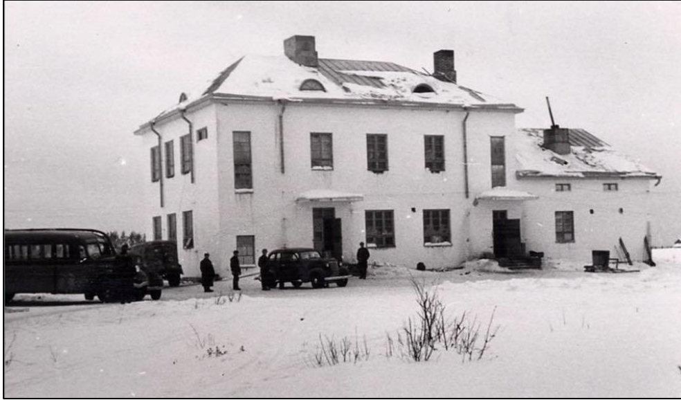
Suvenmäen koulu 40. Kenttäsairaalan käytössä talvella 1943. Linja-auto toimi ambulanssina, jolla sekä tuotiin potilaita että toimitettiin edelleen sairausjunalle Valkjärven asemalle jatkohoitokuljetuksiin sotasairaalaan.

että vihollinen tiesi tämän ilmastakin hyvin näkyvän paikan, mutta oletettavasti sen passiivisuus ei johtunut niinkään kansainvälisten sopimusten kunnioittamisesta, vaan enemmän siitä, että sillä ei olisi ollut mitään hyötyä sairaalan tuhoamisesta. Se tarvitsi lentokalustoaan enemmän saksalaisvastaisilla rintamalla.