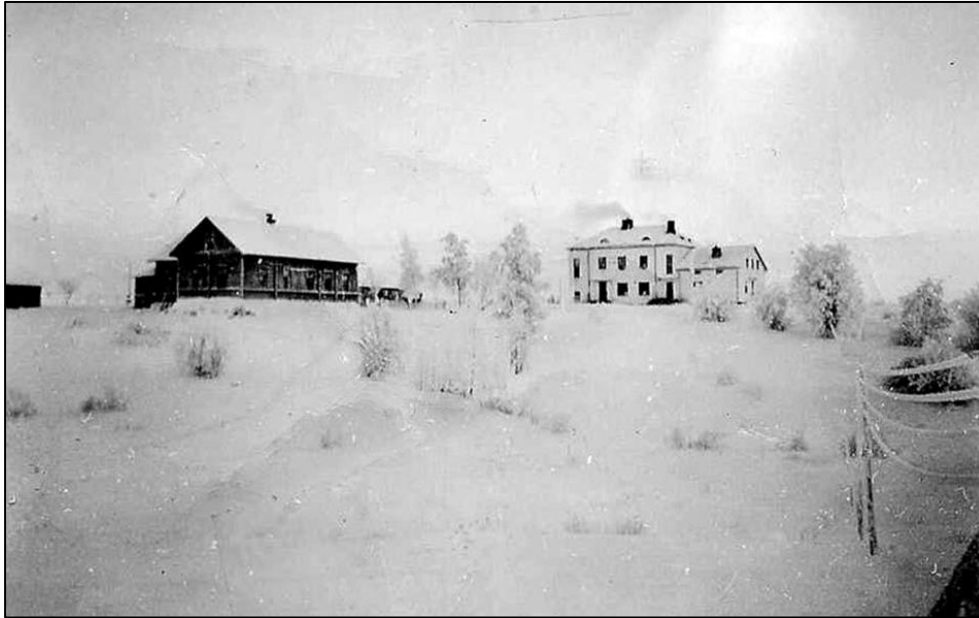
Suvenmäen molemmat kenttäsairaalarakennukset eli uusi ja vanha koulu talvisena pakkaspäivänä. Viimaisina tulipalopakkasina ei paras sijainti.