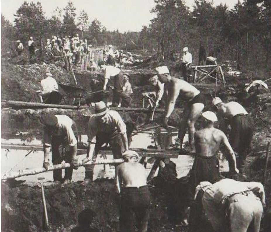
Estekaivanto syntymässä vapaaehtoisvoimin Kannakselle.