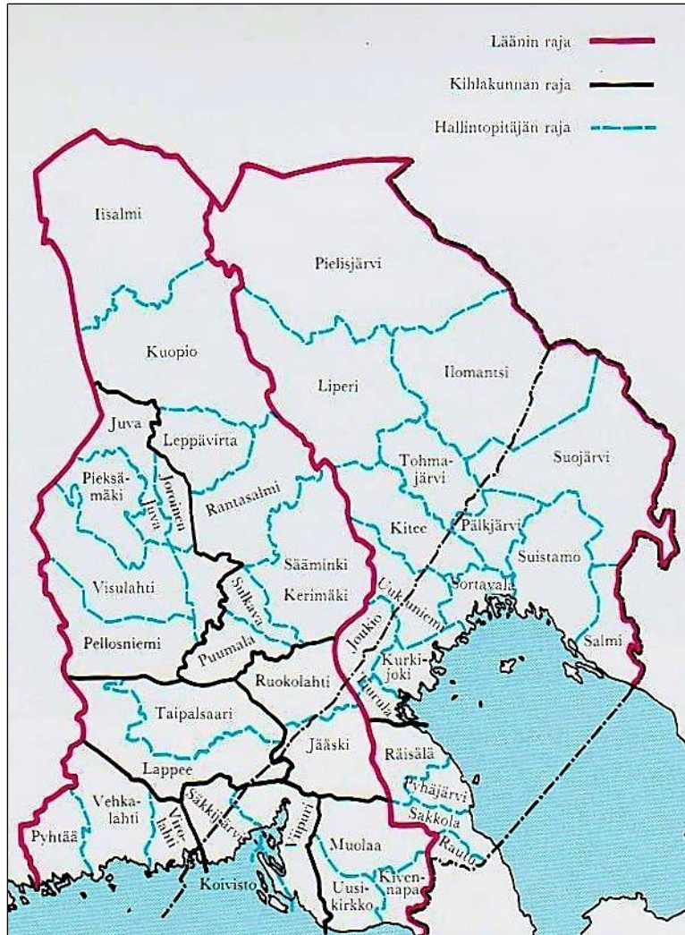
Muinaiset hallintopitäjät Karjalassa. Karjala osa 4, Arvi A. Karisto Oy 1983.

jaettiin kihlakuntiin ja nämä edelleen hallintopitäjiin verotuksen ja oikeudenkäytön tehostamiseksi. Itäisellä Kannaksella olivat Räisälän, Pyhäjärven, Sakkolan ja Raudun hallintopitäjät. Myöhempi Metsäpirtin alue kuului vielä Sakkolaan. Raudun hallintopitäjän alue käsitti suurin piirtein myöhemmän Raudun pitäjän alueen.