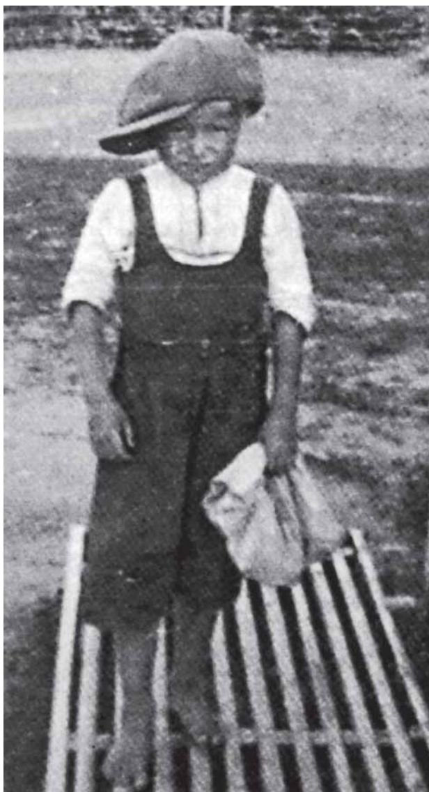
Rautulainen ensiluokkalainen vuonna 1933.

Raudunkylässä sijaitti myöskin Raudun kunnalliskoti entisessä pappilassa Kirkkojärven rannalla. Tämä talo saneerattiin tähän tarkoitukseen kunnan toimesta ja se merkitsi ratkaisevaa parannusta vanhusten ja sairaiden hoitoon.