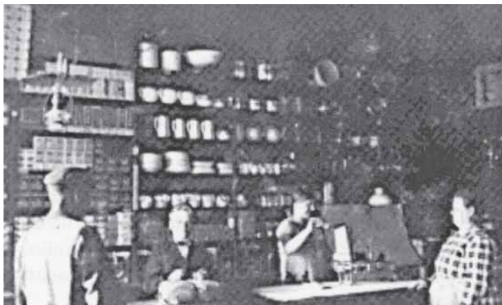
Kermisen puodissa Raasulissa.