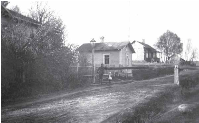
Raasulin raja 1920-luvulla.