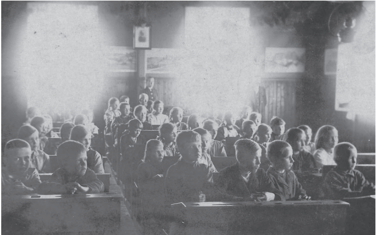
Rautulaisia koululaisia sata vuotta sitten Suomenmällä 1918.

RAUTULAISTEN PITÄJÄSEURA RY:N JULKAISEMA KANNAKSELAISEN PERINTEEN VAALIJA