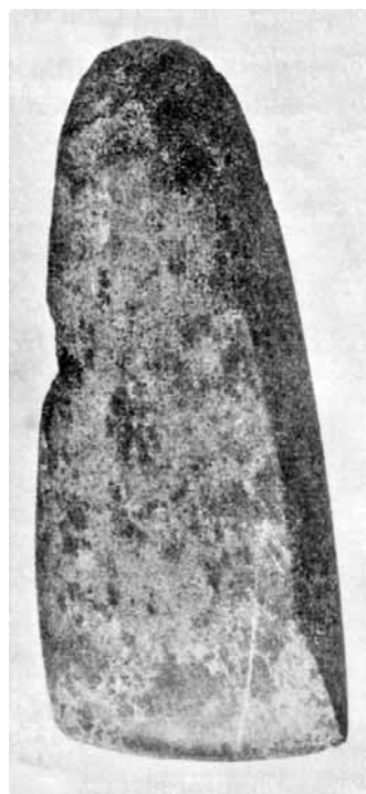
Poikkiteräinen kivi kirves Raudusta.