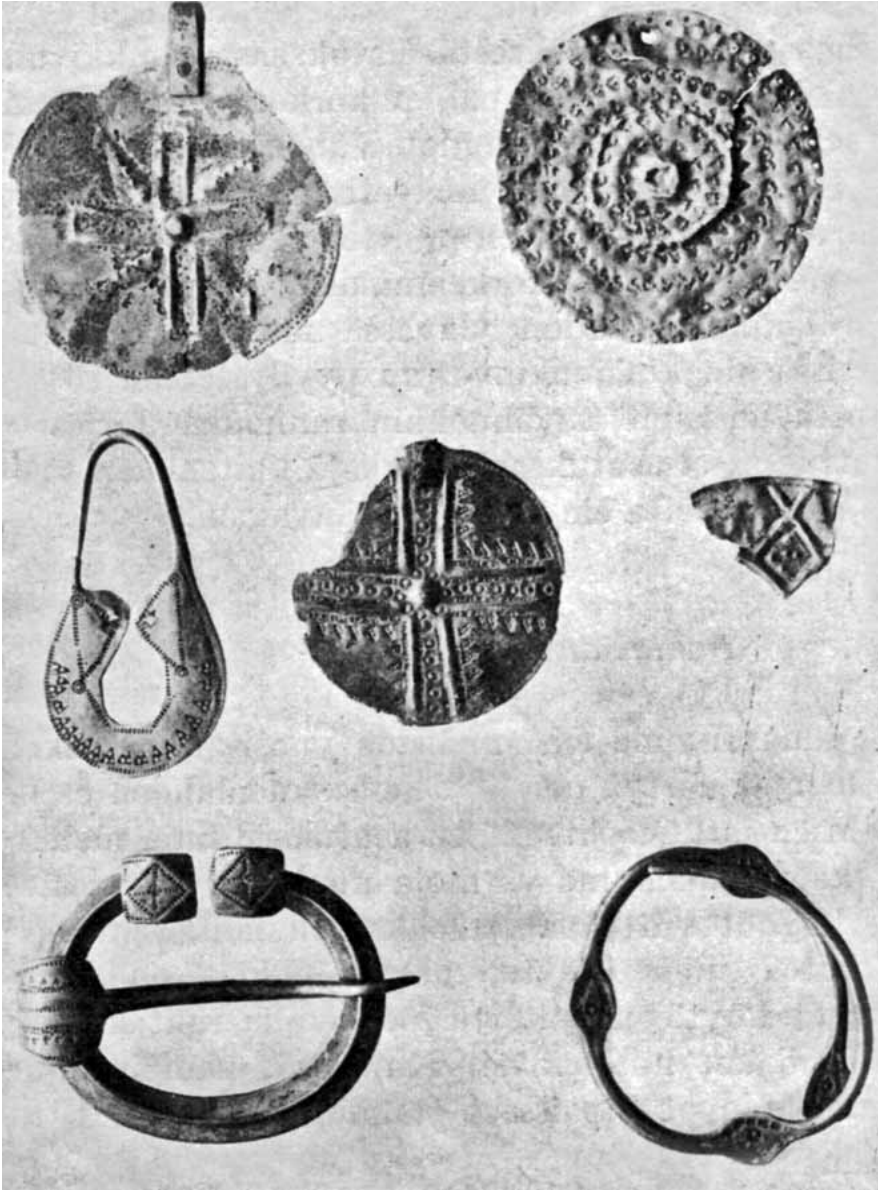
Hopealöytö Vehmaisten Pönniönmäellä. Erilaisia riipuksia ja solki.

Toinen pienempi aarre on löydetty Raudun kappalaisen virkatalon, myöhemmän kirkkoherran pappilan, maalta. Se sisälsi yhdeksän vuosien 936–1008 välillä lyötyä arabialaista ja kahdeksan länsimaista rahaa.