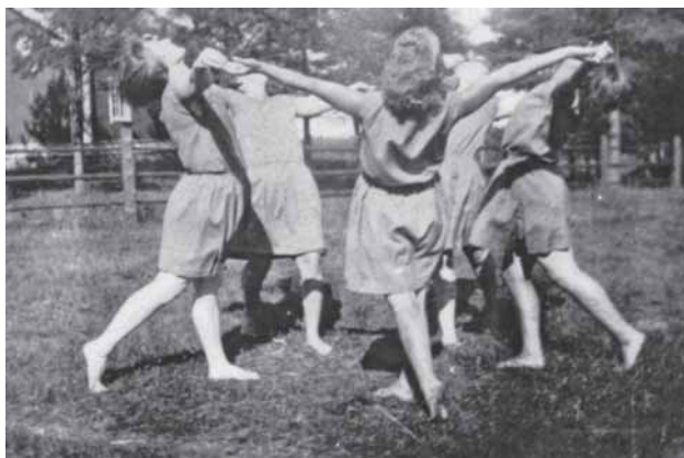
Raudun Nuorisoseuran Naisvoimistelijat

Tamburiinista oli siirrytty lauluun. Tytöt olivat hyvääänisiä ja ohjelmat suunniteltiin jonkin sopivan laulun rytmiiin ja tulos oli onnistunut. Laulu antoi eräänlaista lisäväriä liikkeisiin.