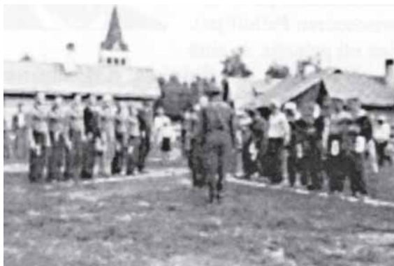
Raudun Nuorisoseuran Pesäpalloilijat kiilassa ja ryhmässä.

Ahkerasti käytiin harjoituksissa, sillä kuntoa ei päästetty alenemaan ja uuttakin oli aina opittava. Taitoa ja kuntoa tarvittiin, sillä kylien välisiä otteluja oli useasti. Pistäydettiin muun muassa naapuripitäjissäkin ja kunnian puolesta taisteltiin kiihkeästi.