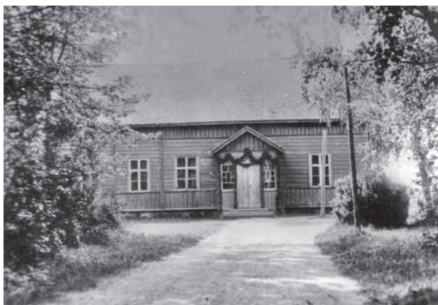
Kirkonkylän Nuorisoseuran talo.

Vuonna 1921 todetaan, että pöytäkirjaa on pidetty seuran perustamisesta lähtien ja seuran arkisto on myös tyydyttävässä kunnossa.