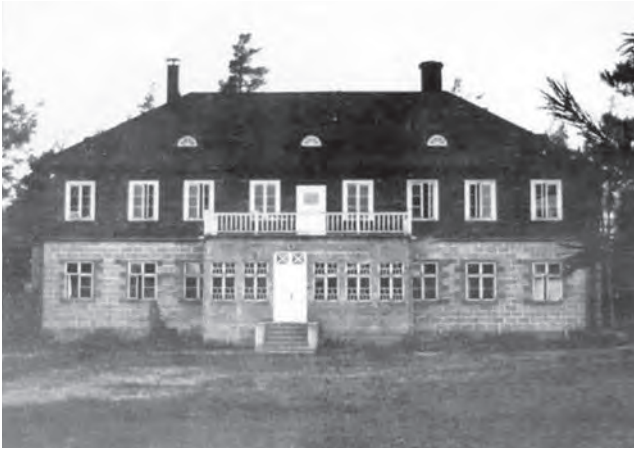
Parantolan rakennus pihan puolelta katsottuna. Kuva Sakkola-sivut.