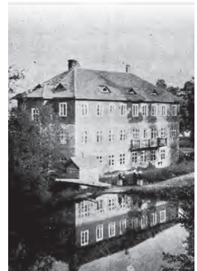
Parantolan rakennus lähteen puolelta katsottuna, täällä kellarikerroksin on näkyvissä.

Vesianalyysin tulokset 1925. Radioaktiivisuutta ei kai osattu edes mitata.