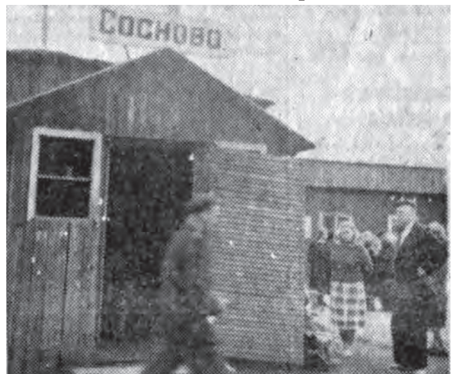
Raudun - nykyisen Sosnovon aseman virkaa tekevä parakki, uusi tiilinen asemarakennus on nousemassa.