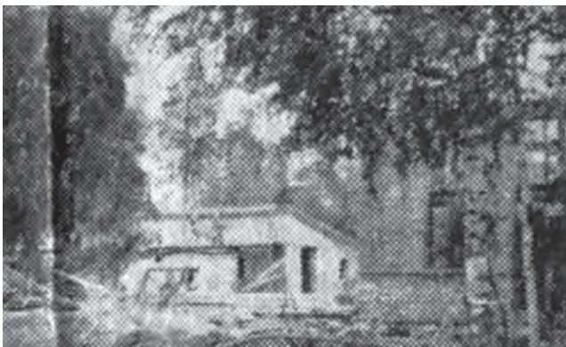
Rakennus osuuskaupan tontilla.

ollut ennallaan mutta eri tarkoitusta palvelevana. Ilmin kaupan paikkeilla oli tavaratalo ja sen vieressä kirjakauppa sekä sekatarvakauppa. Posti löytyi, poliisi ja koulu mutta kaikki uusien isäntien pystytämiä niin kuin melkein kaikki tuohon aikaan jo olikin. Kirkkoa ei paikkakunnalla silloin tunnettu.