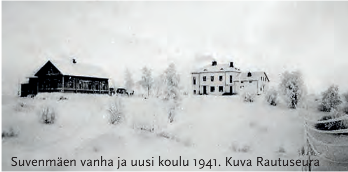
Suvenmäen vanha ja uusi koulu 1941. Kuva Rautuseura

viettä joulua ja talvi kotona, vaikka koti oli vaatimattomampi kalusteiltaan kuin ennen sotaa, se oli kuitenkin koti. Ikkunaverhot tehtiin kreppipaperista ja venytettiin reunaa, että siitä saatiin rimpsua muistuttava. Olimme vähään tyytyväisiä, tärkeintä että olimme jälleen ihmisiä eikä evakkoja.