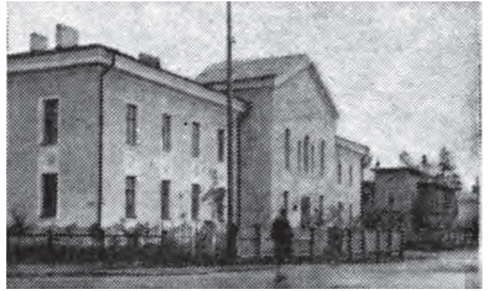
Hinkkasen paikkeille on noussut komea rakennus, liekö koulu.